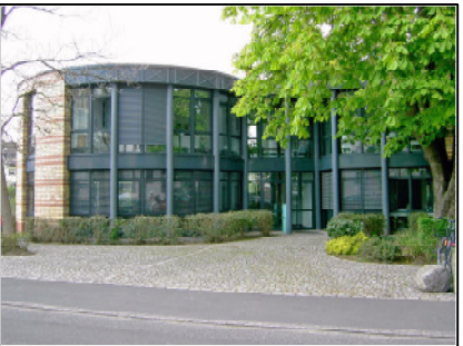
RISK-CONSULTING Hatzfeldstraße 5

Mit öffentlichen Verkehrsmitteln: Ab Köln Hauptbahnhof S-Bahn Linie S11 Richtung Bergisch Gladbach bis "Köln-Dellbrück" (Taktzeit tagsüber :07, :27, :47) (Fahrzeit ca. 14 Min.); Fußweg ca. 17 Min. U-Bahn Linie 18 Richtung Thienenbruch bis "Dellbrück-Hauptstraße" (Fahrzeit ca. 24 Min.); Fußweg ca. 5 Min. Aus Köln Innenstadt: U-Bahn Linien 3 oder 18 Richtung Thienenbruch bis "Dellbrück-Hauptstraße"; Fußweg ca. 5 Min.